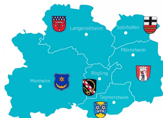
Die 6 im Drei-Ländereck

Bitte nehmen sie auch an den Vereinsveranstaltungen (siehe auch Veranstaltungskalender) teil. Sie fördern damit das Vereinsleben und tragen zum Fortbestand unserer Vereine bei.