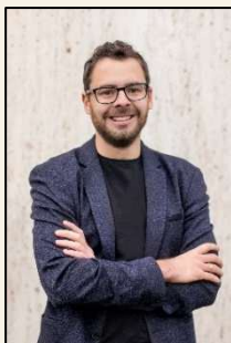
Tobias Eberle (Erster Bürgermeister)

Bitte berücksichtigen Sie die Firmen in Solnhofen bei Ihren Einkäufen und Besuchen.